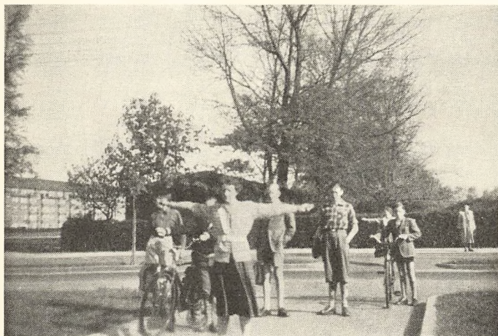
Samme i funktion.

11.—12. november: Skolefester. Der var høj stemning på begge sider af rampen til skolens årsfest. Man havde valgt at spille revy, og det tager jo altid kegler hos de unge. Det var en såkaldt »lagkagerevy« uden no-