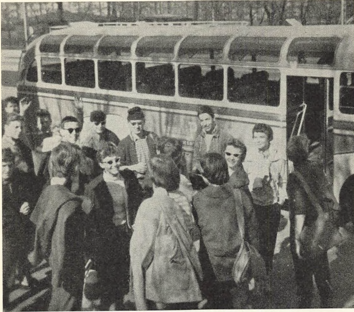
IV a starter til Kalo.

13.—14. februar: Skolefesterne i Folkets Hus. Skolefest og elevkomedie er uløseligt knyttet sammen. Man kan jo nu om dage engagere så mangeartede festlige og flotte underholdningsprogrammer, også sådanne der ville være velegnede netop for en skolefest; men skolen ser noget mere end underholdning i disse elevpræstationer: det menneskeligt berigende og kammeratskabsbefordrende ved at samle sig om en opgave ud over den traditionelle lektielæsning, den inciterende fællesskabsfølelse, det gavnlige i at lære at indordne sig under en helhed, respekten for scenekunsten og dens krav og glæden over at være bare et lille led i en kunstnerisk skabelsesproces.