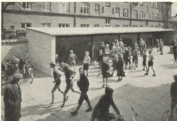
I december indviedes skolens nye læskur. Her kan halvdelen af eleverne opholde sig i dårligt vejr.