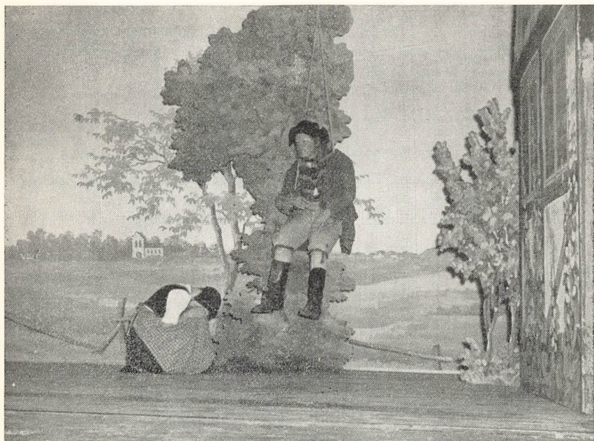
Skolekomedie i november 1958