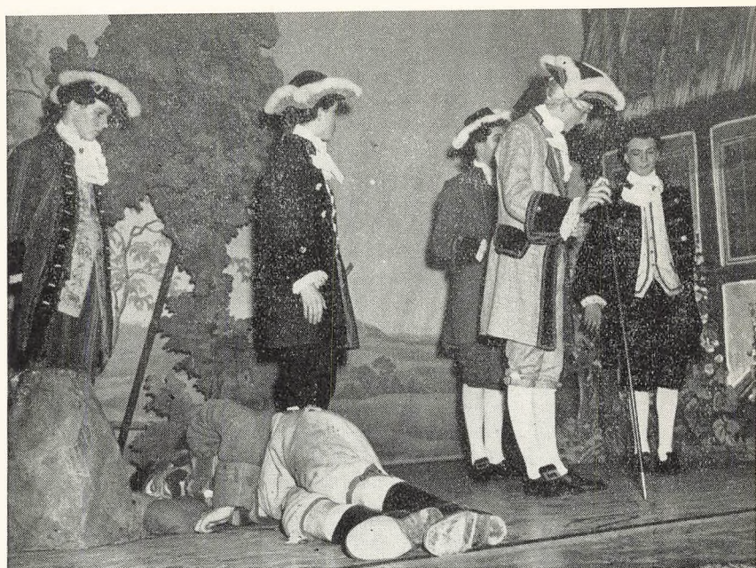
Skolekomedie i november 1958 — »Jeppé på bjerget«