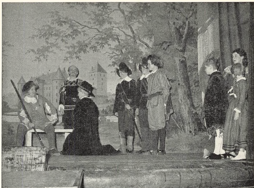
Skolekomedien 1959 — „Kongens Dom“

Kristian den Fjerde opholder sig i parken ved Skanderborg slot og hører med interesse på en enkes bøn om hjælp.