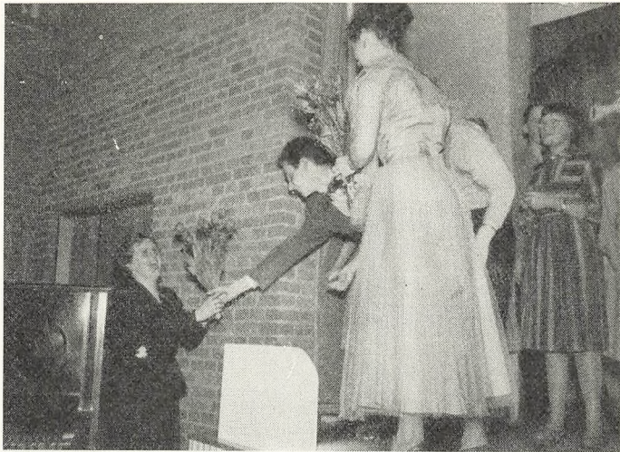
»De 24 timer« på kommuneskolen.

Til skolefesterne om foråret har der altid været fuldt hus, og har børnene moret sig — både tilskuere og aktører —, så har lærerne kunnet glæde sig over også ad den vej at lære forældrekrædsen nærmere at kende og skabe kontakter, der har været af betydning for undervisningen. Disse fester har derfor været lyspunkter i det daglige arbejde.