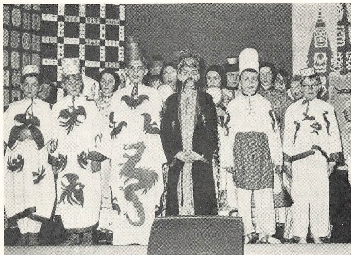
»Nattergalen« på øvelsesskolen. Dekorationer og dragter fremstillet af børnene i samarbejde med lærere.

elever fra tysksindede hjem, som herigennem ønskede at lade de unge få et indtryk af dansk skoleliv, et træk som i nogen grad har holdt sig gennem årene. Efterhånden som den oprindelige hensigt „mættes“, dalede alderen til omkring 14—16 år, idet 8. klasse i stigende grad gik over til at danne den normale afslutning på skolegangen, i en sådan grad at nu ca. 95 % af børnene fra 7. klasse fortsætter med det ottende skoleår. Men man har bevaret det særlige forhold, at der i 8. klasse stadig optages børn fra omegnskommunerne. I skoleplanen er det stadfæstet, at elever fra oplandets kommuner kan optages, for så vidt der ikke i disse findes en kommunal fortsættelsesklasse efter bestemmelserne i folkeskoleloven, og for så vidt disse elever har opnået syv fulde skoleår. Antallet af udenbys elever er vokset stærkt, således at ca. halvdelen af eleverne i de to 8. klasser i en årrække har været fra oplandet. Eleverne fra byen og fra oplandet blandes i de to klasser, et forhold der til en vis grad kan frembyde undervisningsmæssige vanskeligheder, men som tilfører livet i 8. klasserne en friskhed og et samarbejde mellem „bybørn“ og „landbørn“, som er af stor værdi.