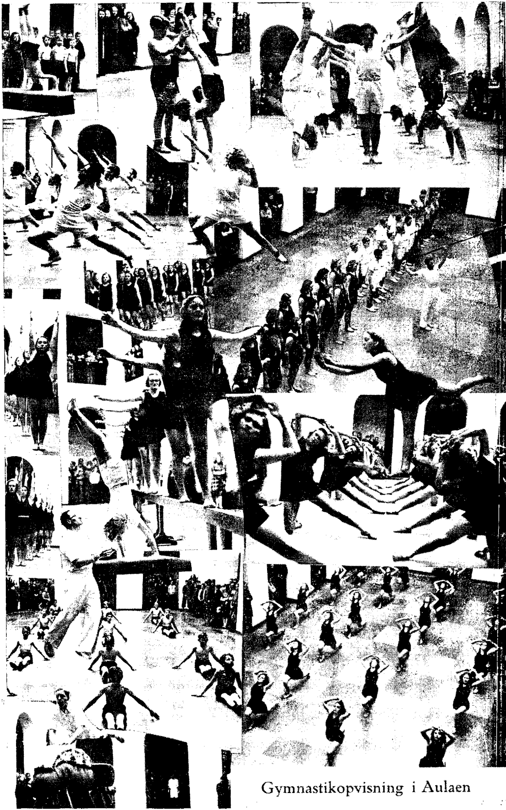
Gymnastikopvisning i Aulaen