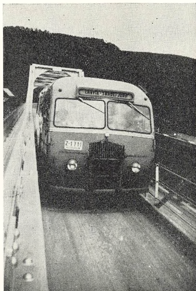
Det gik —

Næste morgen kørte vi i bus op ad de kendte norske hårnålsveje over højfjeldet til Rjukan. På denne tur fik vi rigtig lejlighed til at