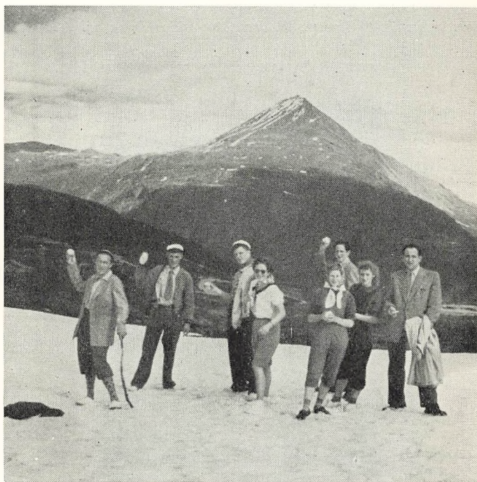
Gausta-toppen i baggrunden med sine 1883 m.

Tirsdag morgen ved nitiden startede vi fra Gaustas fod. Vi havde fint vejr og solide madpakker i tasken, og så gik det opad mod toppen. På det første stykke vej var der tæt skov, bagefter kom et stykke med græs og små buske hist og her. Der, hvor græsset begyndte, kom vi til en hytte, indrettet som et hotel, hvor vi indtog en forfriskning. Derefter gik vi videre, og nu var der sten og atter sten. Da vi kom