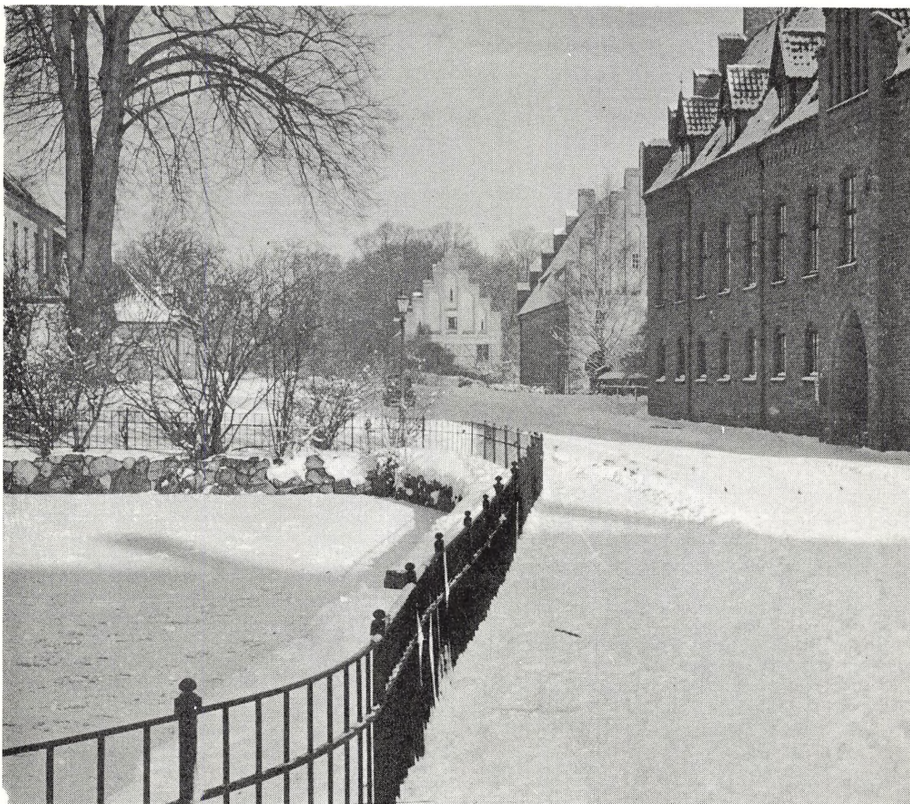
Et — på baggrund af den meget milde vinter — måske lidt uaktuelt billede, der blot skal minde om, at der altid er dejligt på Herlufsholm.