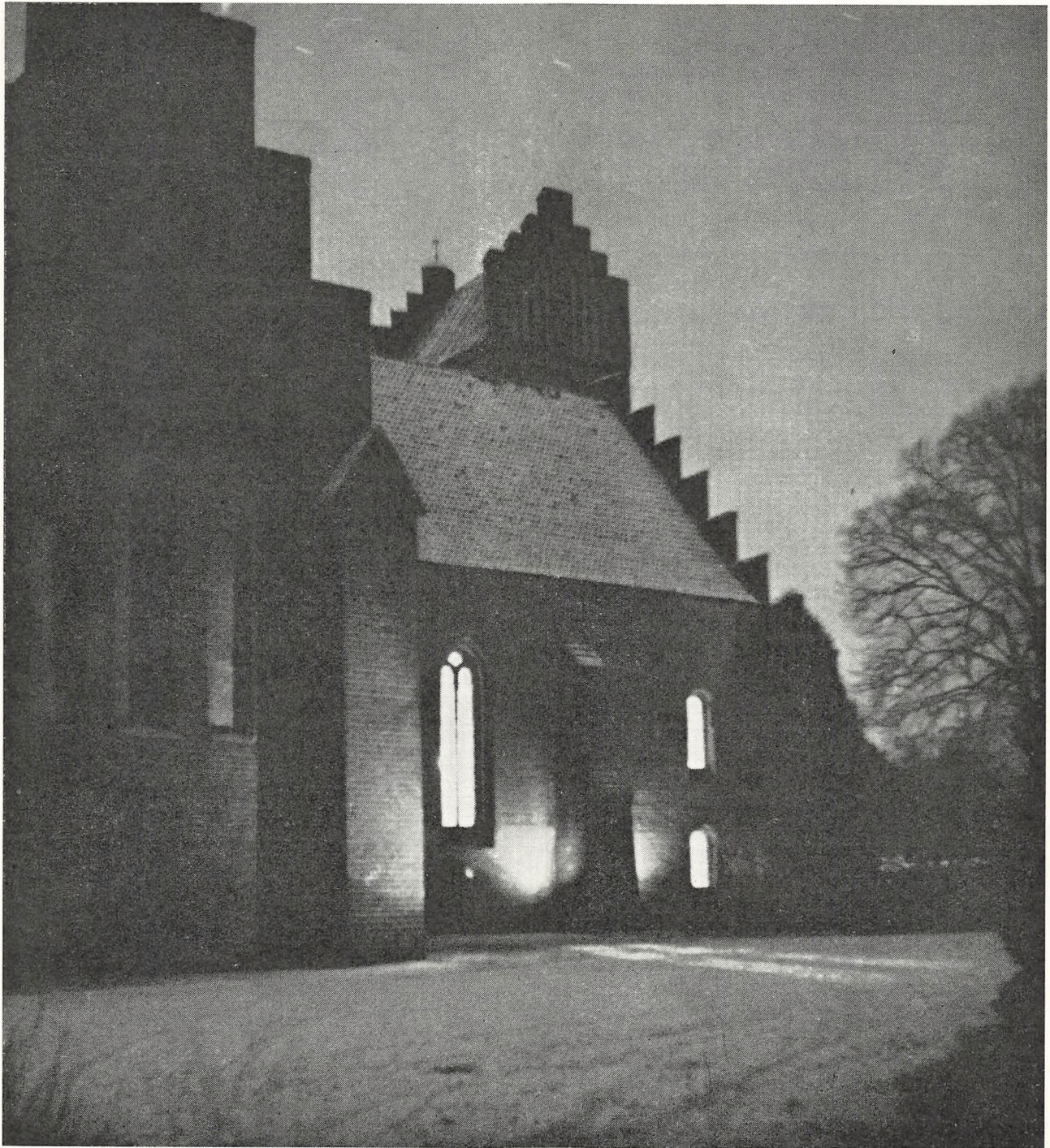
Herlufsholm kirke ved juletid