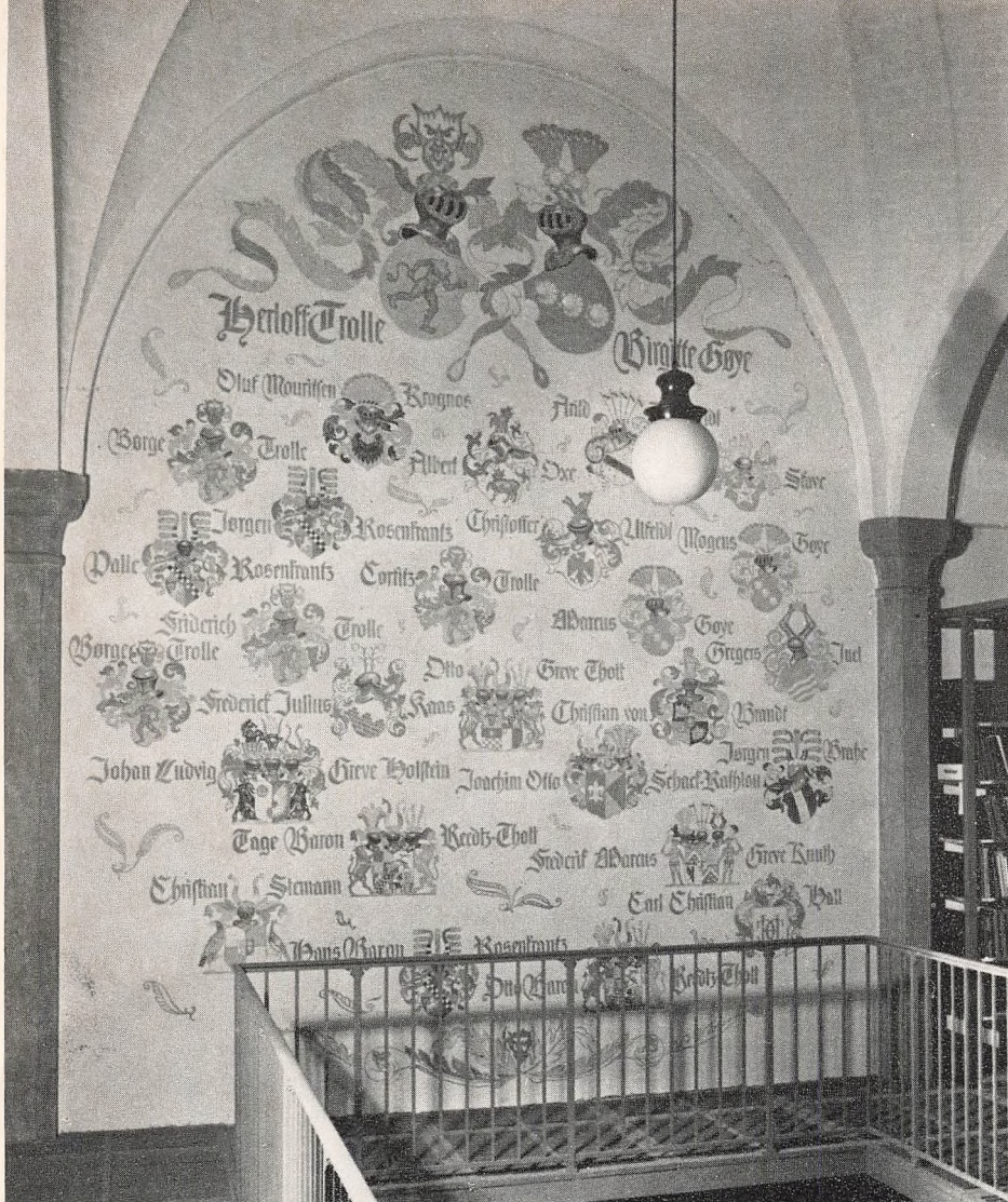
Våbenvæggen i biblioteksbygningen. Halls monogram-i-skjold skimtes nederst til højre.