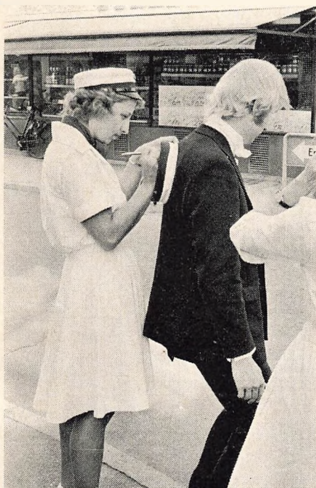
To fra studenterholdet sætter navn i de nyindkøbte huer, foråret 1975.

Jeg foretrækker at tro, at der ikke mere findes gamle herlovianere som er betænkelige ved begge køns tilstedeværelse på vores skole. Men hvis der skulle findes nogen, vil jeg sige til dem: Vær