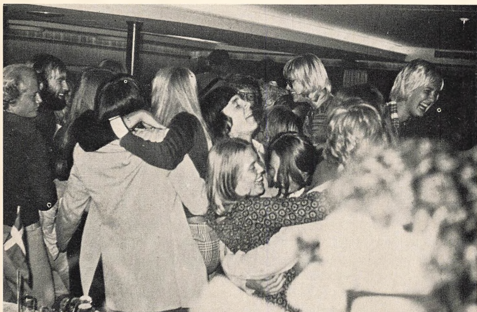
Lanciers'ens Femte Tur.