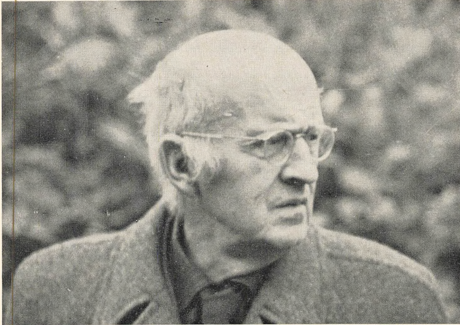
Det stærke, opmærksomme blik. Nærten på besøg i en have, hvis ejermand forklarer og demonstrerer. Billedet er fra et af de sidste år.

— og skyldes far's rige personlighed. For alt dette vil jeg gerne her sige en varm og dybtfølt tak.