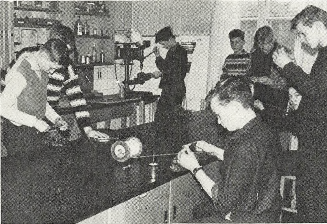
Elever fra gruppe II, sløjdfysik.

„Med lov skal land bygges“ – „det forstod vi i 7. a, da vi sammen med 52 andre grupper spredt ud over hele landet var med til at udarbejde den Juniorgrundlov, som Danmarks radio igennem en radioserie for piger og drenge lagde op til. – Og endnu tydeligere forstod vi det, da vi, sammen med unge fra næsten alle egne af landet, overværede lovens stadfæstelse i radiohuset den 25. februar.