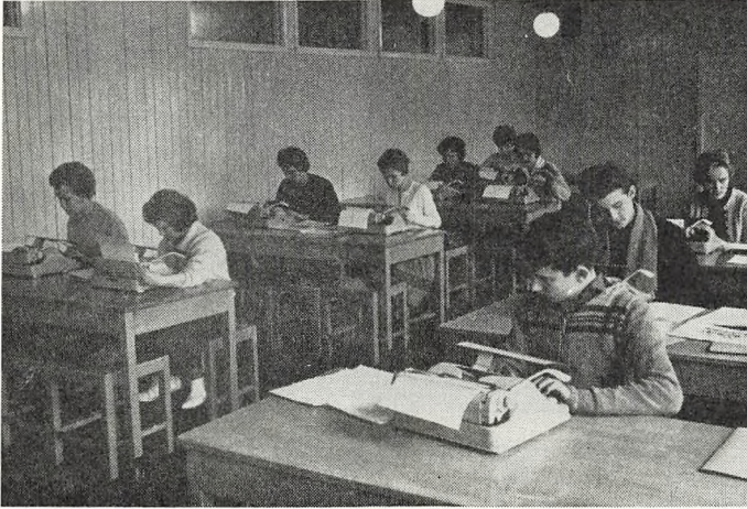
Elever fra gruppe I, maskinskrivning.