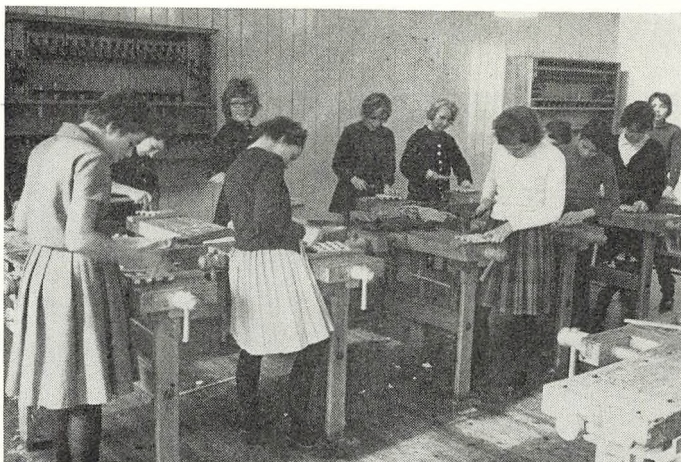
Pigerne, aktive på sløjdsalen.

De større klasser har aflagt besøg på forskellige museer, samlinger, institutioner og virksomheder.