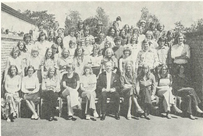
HF afgangsklasserne 1975

specielle ønsker vedr. arrangementer, som skolenævnet kan lægge op til, hører vi gerne fra Dem.