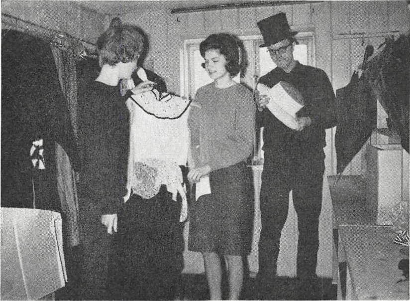
Elever udsøger kostumer i skolens private teatergarderobe, der er installeret i et loftsværelse i rektorboligen og — takket være gaver fra interesserede — allerede ganske godt forsynet.

bidrag; både særprægede, f. eks. ældre, ting og almindelige beklædningsgenstande har interesse; de sidste kan vi evt. ved omsyning gøre anvendelige.