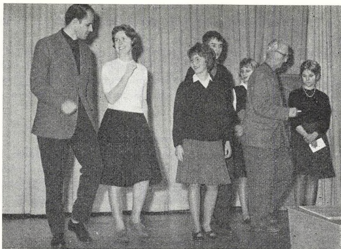
Fra de indledende prøver på skolekomedien.