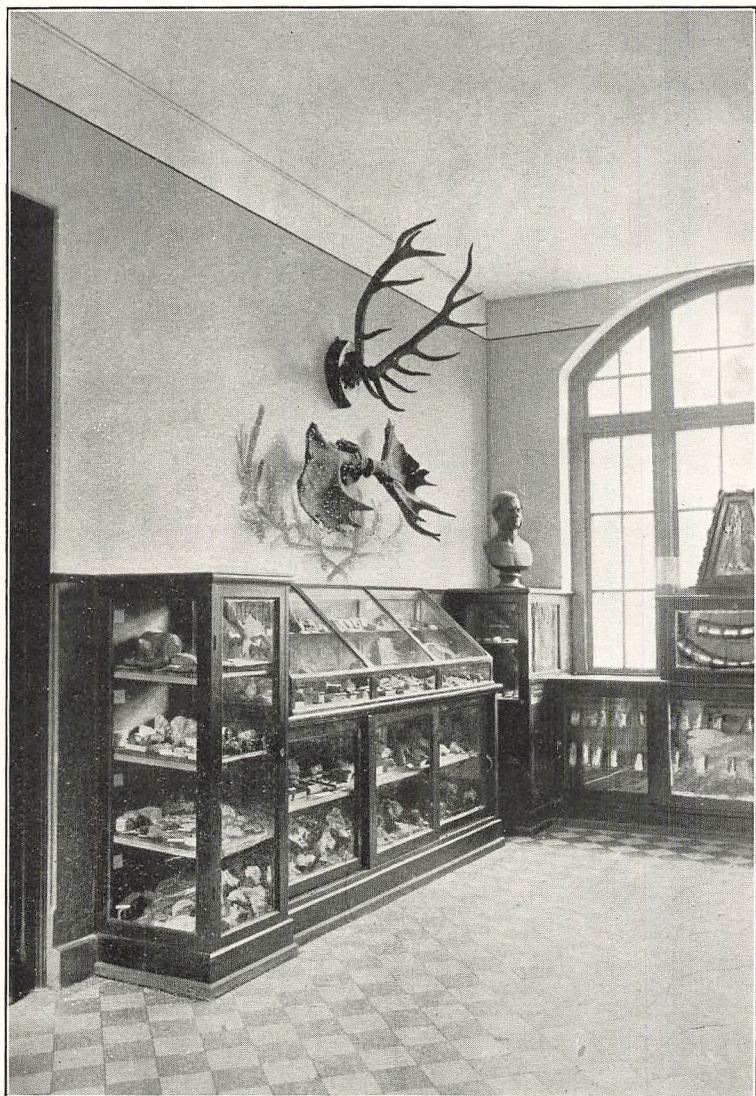
Geologisk Hjemstavnsamling og et Hjørne af Oldsamlingen med Thriges Buste.