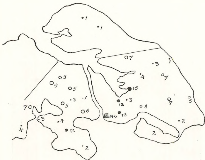
Søndersborg Statsskoles Opland.