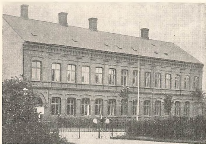
Esbjerg Realskole omkring 1900.