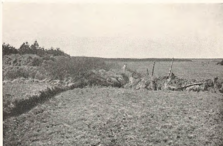
Isbjerg-Sig Stampemølle. Møllen har staaet paa Forhøjningen i Midten til venstre. I Forgrunden den udtørrede Møllese; bag Mølledæmningen „Baghølet“.

11) Isbjerg Vandmølle, Varde Landsogn, omtales første Gang 1433, da en Borger i Varde skænkede den til Ribe Domkapitel. Det har næppe nogensinde været nogen særlig god Mølle. Dels har Tilløbet altid været