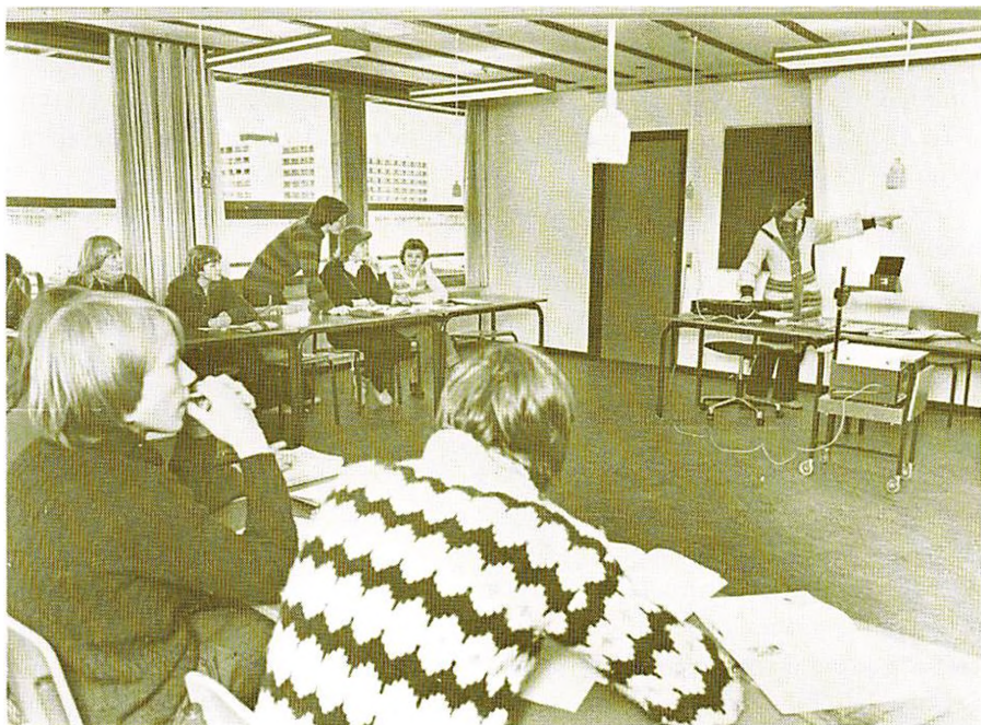
Undervisning på Kvaglundskolen.

af byggeriets 2. etape, som omfatter 1 hjemmeafsnit med 7 klasseværelser og 2 holdrum omkring et fællesareal.