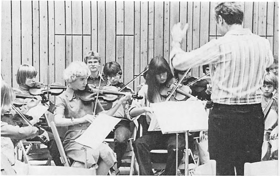
»Musikværkstedet« på Fourfeldtskolen.