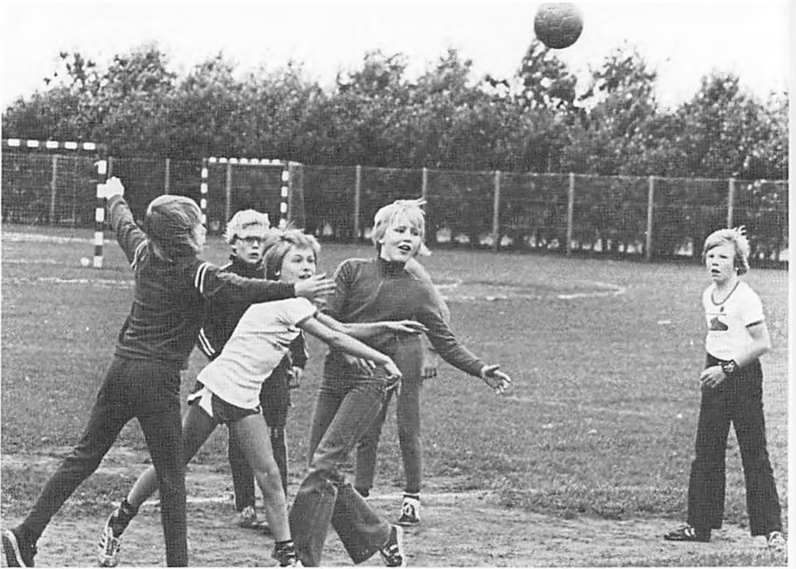
Skolernes store boldspilfest afvikledes den 12. og 13. september i Veldtofte Idrætspark.