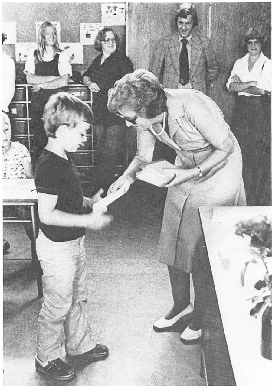
Velkommen i børnehaveklasse.