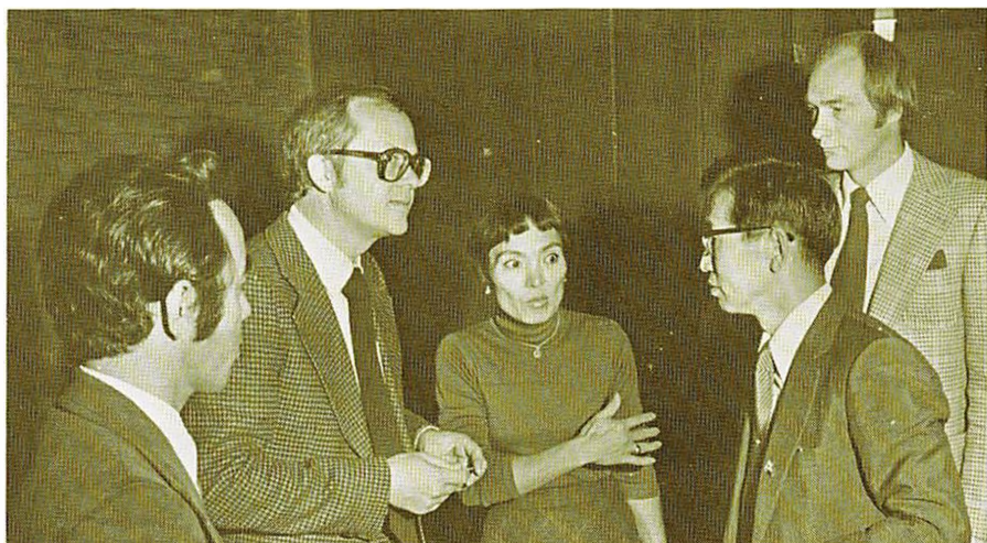
Besøg fra Japan.