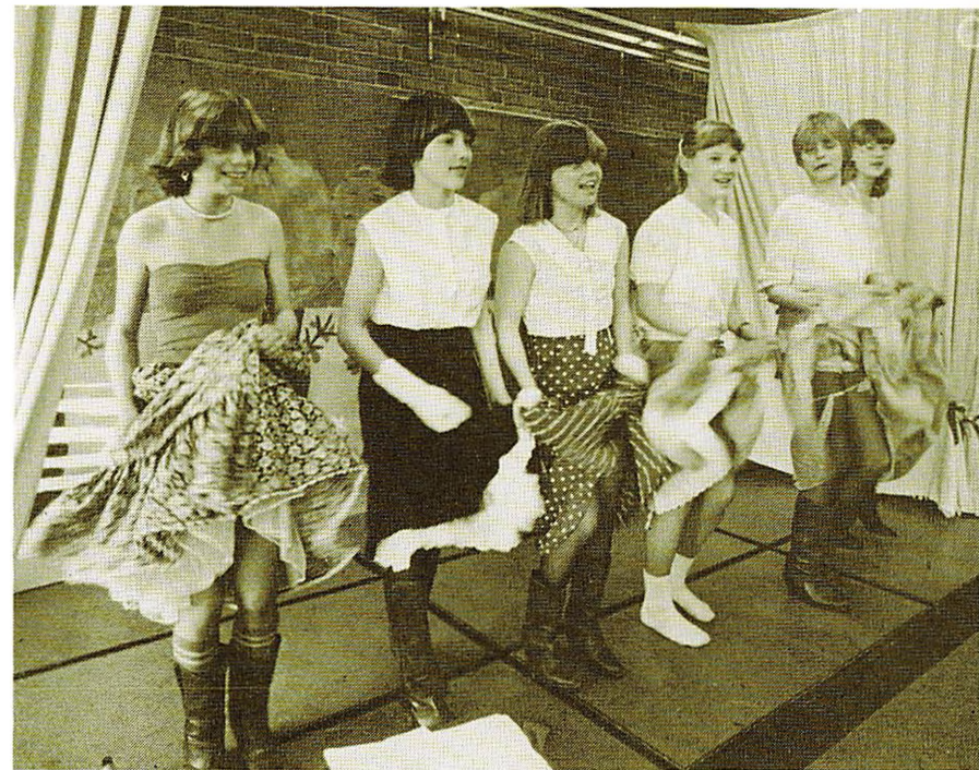
Cancan på Vestervangskolen.