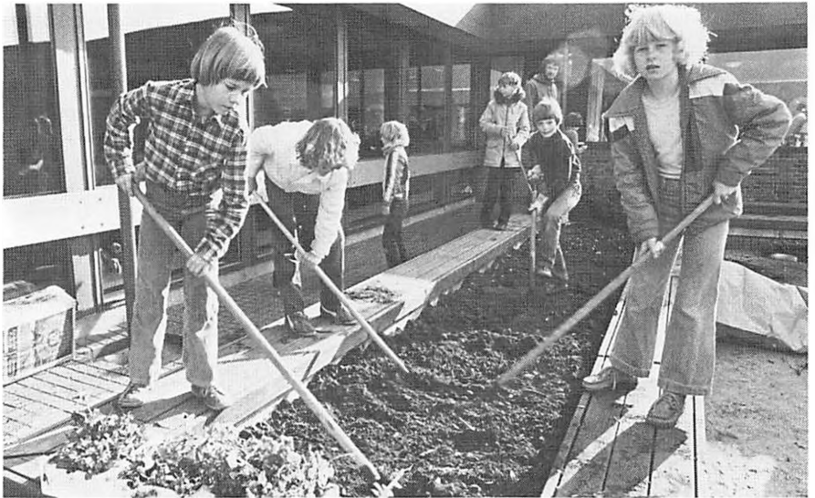
Featureuge på Vestervangskolen.