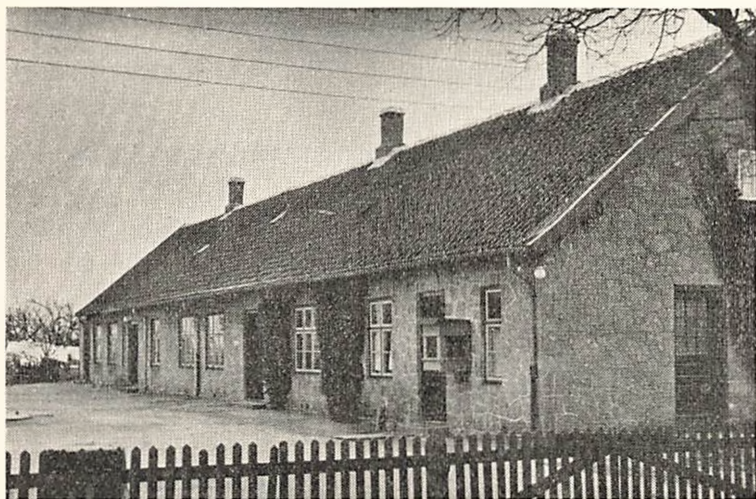
Hovby skole opført 1874, tilbygget 1889.