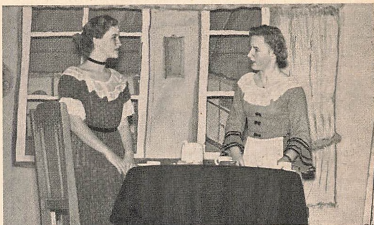
Billede fra skolekomedien 1954