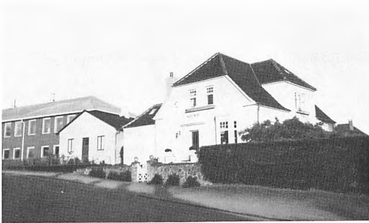
Inspektorbolig og fløj af den nye tilbygning (set fra Præstøvej)