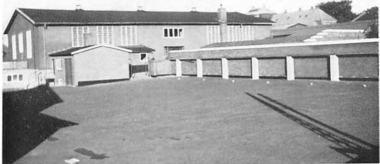
Den nye legeplads med sportshallen i baggrunden