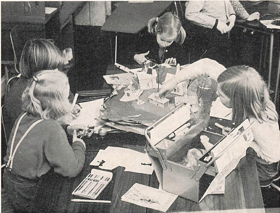
Gruppearbejde i 2. kl. på Nordre skole.

Der kunne nævnes mange andre forhold af betydning for planlægning af skolevæsenet. Det er der ikke plads til her. Forhåbentlig bliver der forud for ethvert byggeri lejlighed til gennemgribende drøftelser mellem elever, lærere, skoleledere, arkitekter og de administrerende myndigheder. Sådanne samtaler er nødvendige for at sikre den bedst mulige sagkundskab, men også for, at det ikke efter byggeriets afslutning skal kunne siges, at der har været handlet hen over hovedet på den ene eller anden part. Man må så håbe, at hver enkelt instans holder sig sin kompetence for øje, og at alle er indforstået med, at demokratiet også på skolens område vil resultere i løsninger, der har kompromisets karakter.