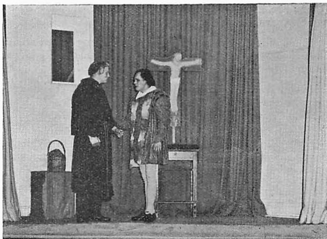
Fra Opførelsen af »Romeo og Julie«: Munkecellen.

Søndag den 15. Februar foretog de svenske Gæster og deres danske Værter i 12 Biler, stillet til Raadighed af Forældre, en Rundtur i Sollerod Sogn. Derefter var der Fest og Opvisning paa Gl. Holte Skole. De svenske Gæster afrejste Mandag Morgen.