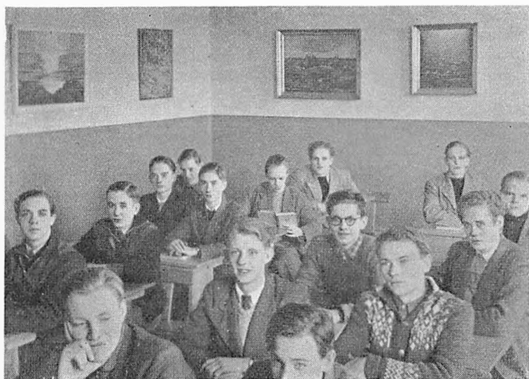
I mn. b.

Der laa i alt fald i manges stemmer en ægte sorg, da konservatoren ankom og gav sig til at tage billederne ned og pakke dem i store kasser. Der blev saa tomt i klasseværelserne. Man savnede noget. De hvide vægge var blevet stumme — igen.