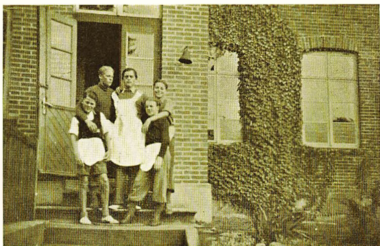
Økonoma og Piger er sendt til Havet. — „Samfundshjælperne“ træder i Funktion.

gynder efter en Ferie eller Week-end. Skulde Hjemmet af særlige Grunde ønske anden Afrejse fra Hjemmet, maa Skolens Tilladelse indhentes forud.