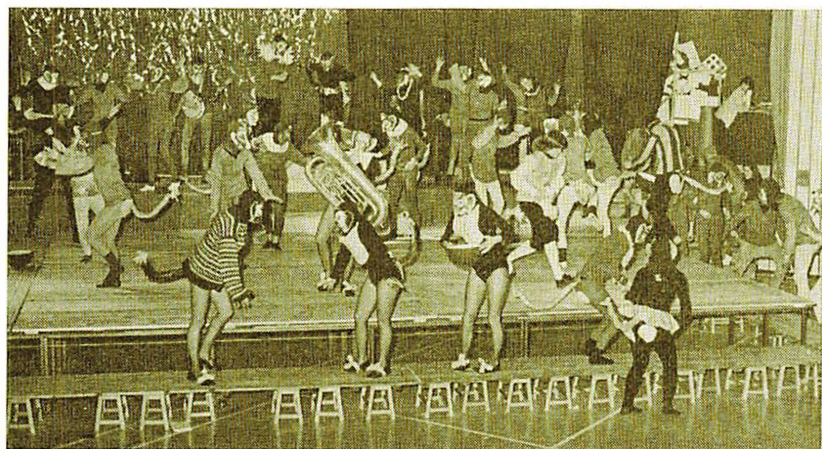
Fra årets skolekomedie (Holberg: Niels Klims forunderlige rejse)