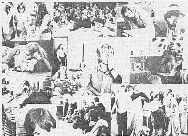
Klip fra studieuge - fotogruppens album