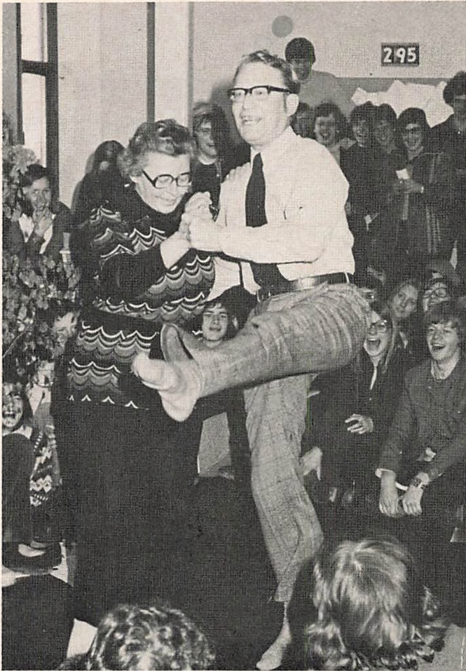
Afdansning på 3g'ernes sidste skoledag