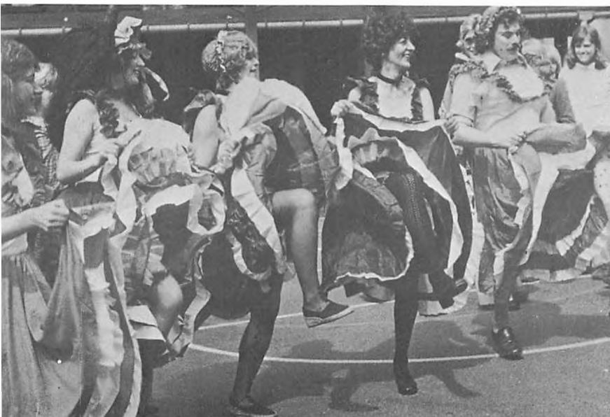
g'ernes sidste skoledag.

Mørkekammersekr.: Frank Bringstrup, 2z F