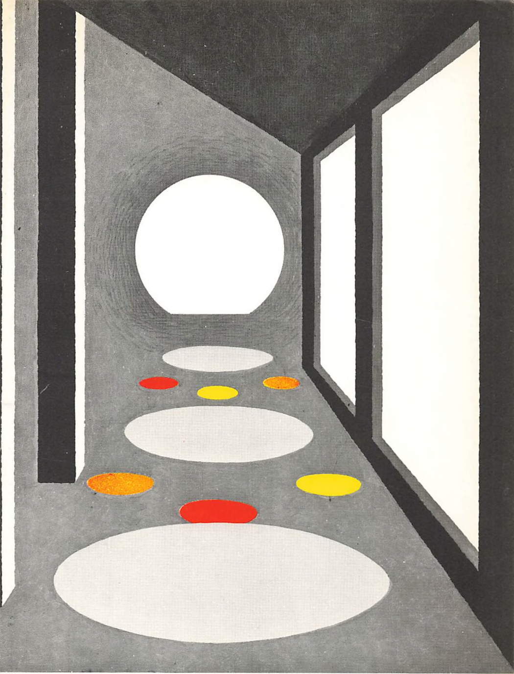
skive gymnasium 1978