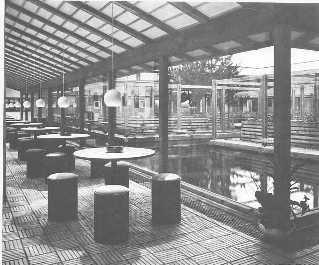
Spisegang og vandgård.