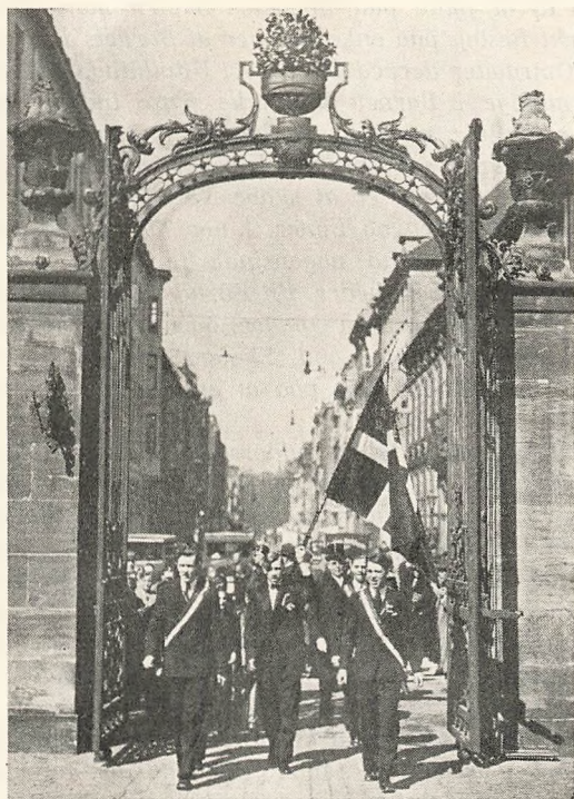
Vestre Borgerdykskoles Indmarsch.

o. a. Læser man de to Skolers Historie igennem, viser det sig imidlertid, at langt mere betydningsfulde end Teorier er de Mennesker, der underviser i Skolerne. Der har ved Borgerdykskolerne været mange særprægede og dygtige Lærere. Herom vidner de mange fremragende Mænd, der er ud-gaaet fra Skolerne.