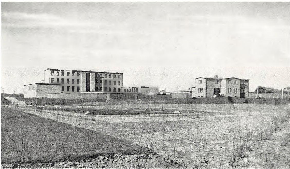
Skole, Pedelbolig og Rektorbolig set fra Sydvest.