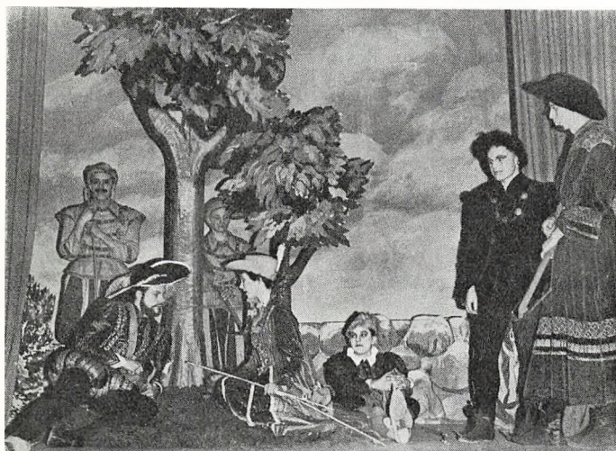
Scene fra opførelsen af »Cante«.