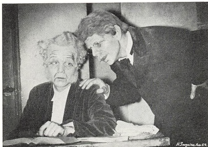
Esdras og dommer Gaunt i »Vintersolhverv«.