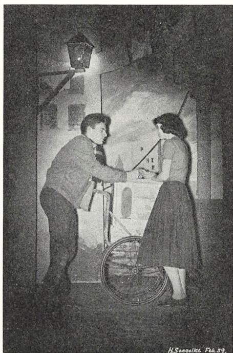
Fra opførelsen af »Vintersollherv«: Mio og Miriamne.

frk. Weygaard. Man besøgte følgende steder: Heidelberg (slottet, universitetet, Altstadt, Königsstuhl) — Bingen (udflugt til Moseldalen, Rüdesheim, Lorelei-klippen, Pfalz, Bacherach) — (ad Rhinen til) Koblenz (domkirken) — Hamburg (Hagenbecks dyrepark, havnerundfart, Elb-tunnelen, St. Michaeliskirken). Der over-