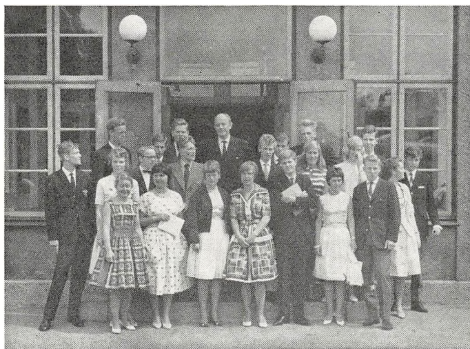
Realeksamenshold b 1961.