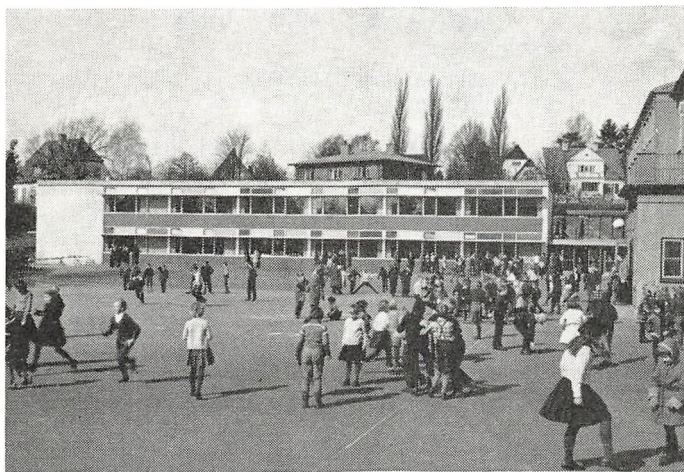
Skolens nye fløj (»vestfløjen«).

Søndag d. 17. december sang elever fra Holte Gymnasium under ledelse af fru Kirk julesalmer i Holte kirke. Det var 10. gang, dette fandt sted ved en gudstjeneste op under jul.