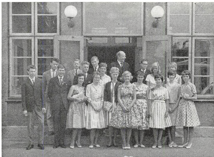
Realeksamenshold a 1961.