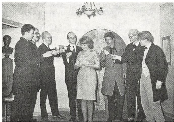
Slutscenen af »Apollon fra Bellac«.