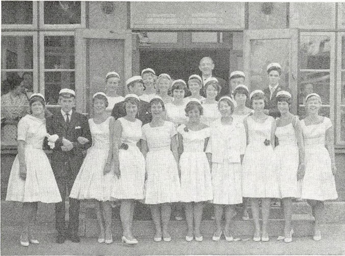
De nysproglige studenter 1961.