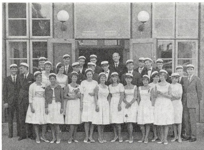
De matematiske studenter 1961.