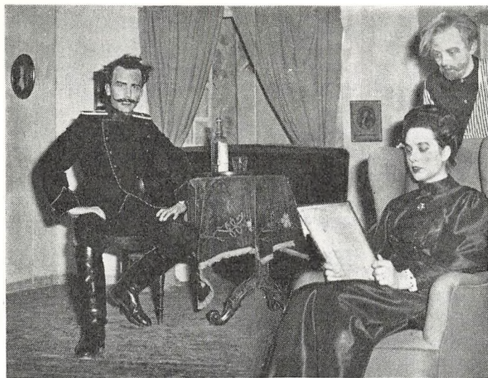
De tre rollehavende i »Bjørnen«.