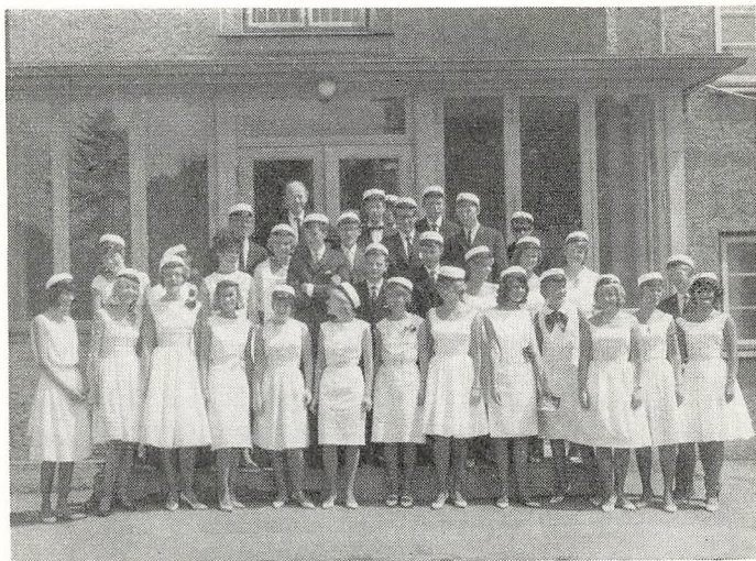
De nysproglige studenter 1963.