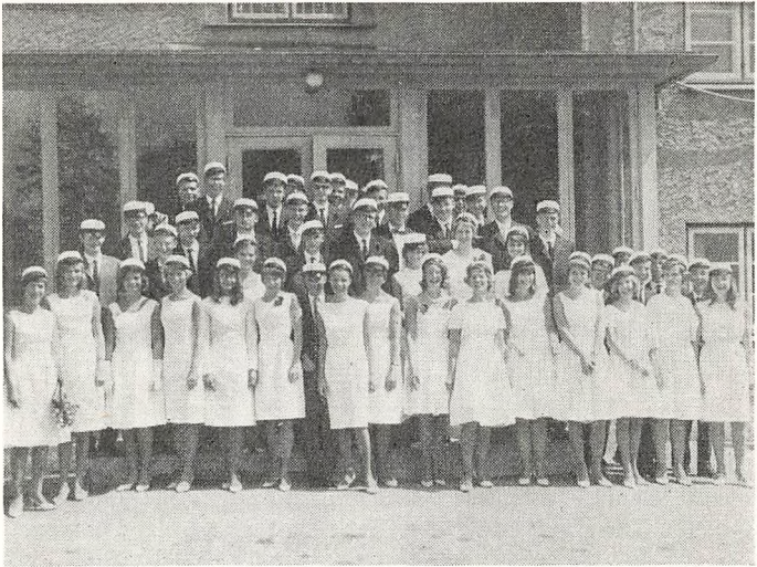
De matematiske studenter 1963.