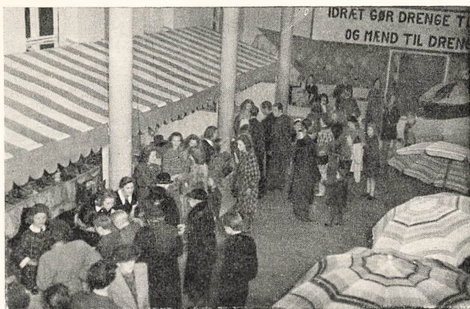
I ra Basaren: Tombola og Restaurant i Festsalen.