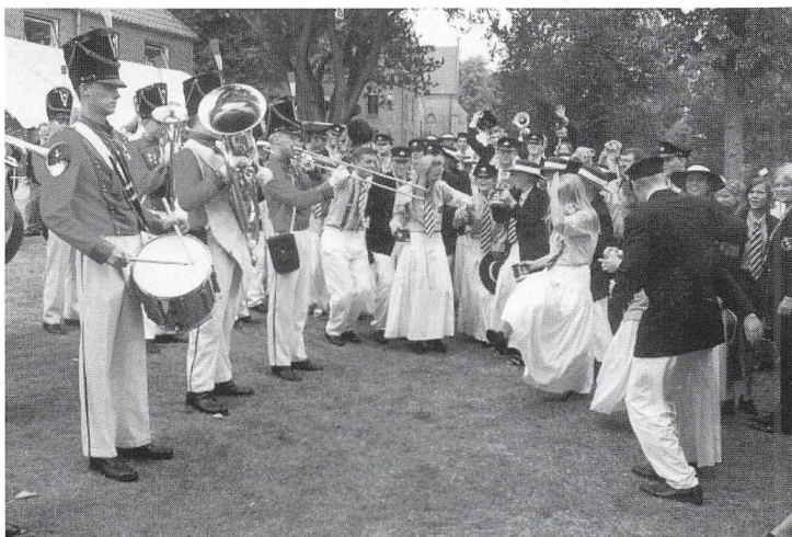
2.g's gave til 3.g: Tattoo-besøg af Roskildegarden – Regeringen tog sig straks en svingom!