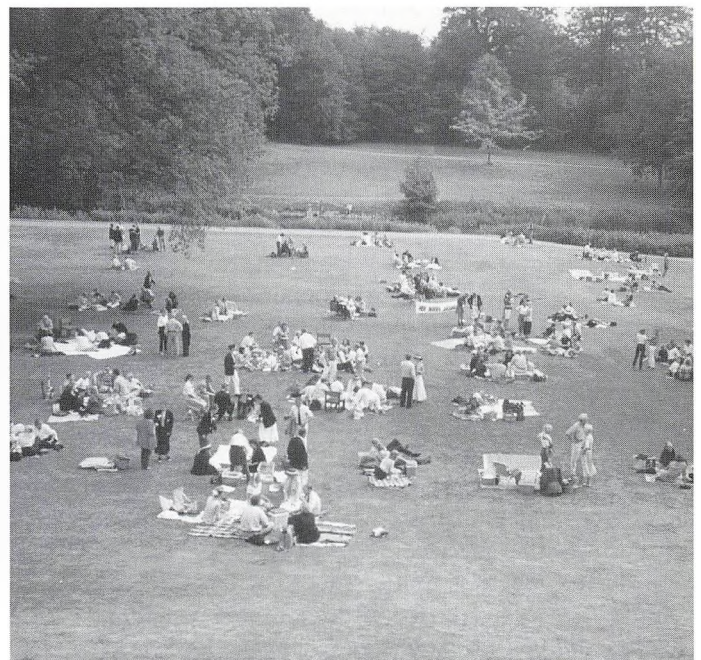
Et vue fra forstanderlejligheden.