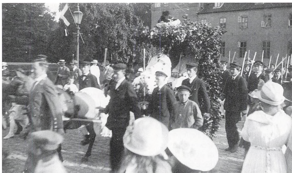
Fuglekongen hylides. Foto 1915.

for første gang optræder på listen, bl.a. som festdekoratører og »Ambassadrice for oplandet«. Det samme år finder man også »Plebselærling på prøve.«