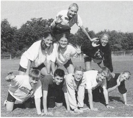
Pyramidebyggeri af skrøbeligt materiale – en krævende samarbejdsøvelse.

og skolen har, og man mødte gymnasiets tilgang til temaet »skabelse« – de kosmiske skabelsesteorier belyst af naturfagslærerne – skabelsesmyter og kunstnerisk kreativitet præsenteret af humanisterne. (Og hertil les l'anciers og fundamentale elementer i sprogindlæring, mere bevidst udforsket). Da alle 1.gere samtidig kom igennem dramalærerens magnetfelt et par gange, var de i grupper parate til at dramatisere skabelsen i diverse selvkomponerede optrin. Både Vorherre og Zeus samt højaktuelle små grønne fimremænd fra Mars gik til Visdommens Æbler for at demonstrere, hvilken appetit man havde fået på den gymnasiale fremtid. Der var også appetit på grillmaden.