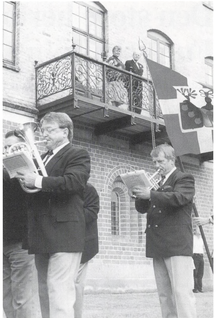
Forstanderparret hyldes på balkonen.