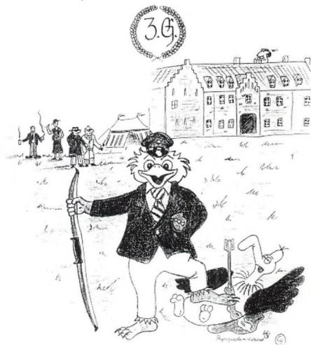
Forsiden i en Fugleskydningsprotokol.

Den Storr Berlovianske Fugleskydning Anno 1986.