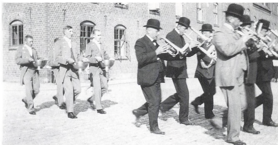
Chokolademarchen med gæver og bøver ophørte, fordi tiden var løbet fra den. Foto 1921.

I »gamle dage« bar 3. g-erne (eller 7. klasse eller Mesterlectien, som de kaldtes) kongen i guldstol ind i Vestibulen,