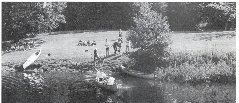
Susåen var en af de »våde« forhindringer på Store-Legedag.

Og så har vi endda slet ikke været inde på den internationale studentereksamen, IB, som har en selvstændig målsætning – og som vi nu har forpligtet os til at koordinere med Herlufsholms kultur og mål. Både vi og IB-organisationen har selvfølgelig sikret, at der ikke er modstridende intentioner – men forskel i accenten vil der være, og det bliver naturligvis fra et målsætningssynspunkt noget af det, der må arbejdes med i fremtiden. Foreløbig arbejder vi på alle felter med at forberede undervisningsstarten fra skoleåret 1997, kanonerne skal køres i stilling – og Deres medarbejder i felten vil senere rapportere fra slagets gang. (Se Heis' artikel i dette nummer).