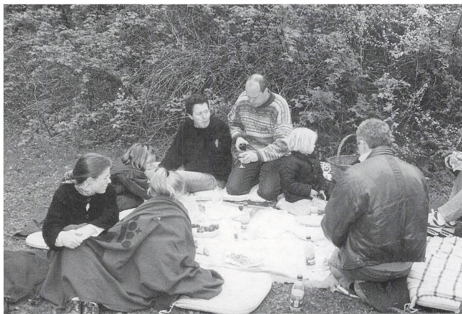
Frokost før finalen.

At vi har vundet denne væsentlige filologiske sejr, er naturligvis glimrende. Et sekundært problem er, om vi så kan vinde næste års FIK-FAK. Mød derfor op i Charlottenlund Skov for enden af den store plæne ved Bregnegårdsvej, Kr. Himmelfartsdag, torsdag den 8. maj 1997!