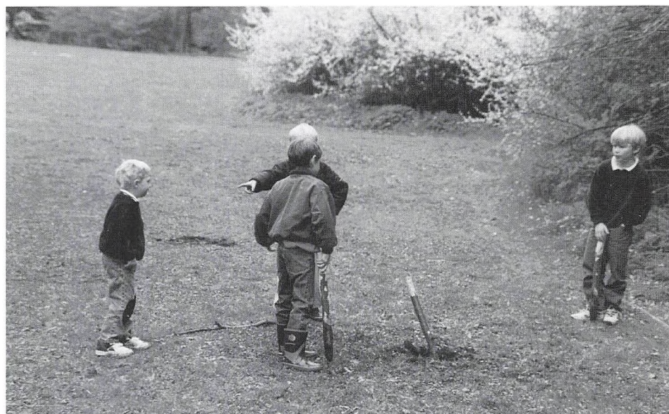
»Øvelse gør mester«.