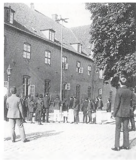
Endnu i 1916 fandt Fugleskydningen sted foran Skolebygningen.

Første gang gevinsten et skrivebord omtales, er i 1864 (pris 22 rigsdaler). I 1974 er prisen kommet op på 27 rdl, men i 1875 koster det 56 kr. (det år skiftede man møntsystem). Samme skrivebord – som jo stadig i hvert fald symbolsk eksisterer som gevinst nr. 1 – ændres gennem årene i kvalitet fra nøddetræ over egetræ til mahogni, og i benævnelse, idet det går over til at blive benævnt »Herrearbejdsbord«. I 1887 er prisen på skrivebordet steget til 60 kr. Det var samme år, at 2. skydepræmie bestod af en æske med 100 cigaretter til i alt 4 kr. Og apropos tobak, så var i 1895 præmien til den, der nedskød kroppen et cigarfuttel til 2,50 kr.