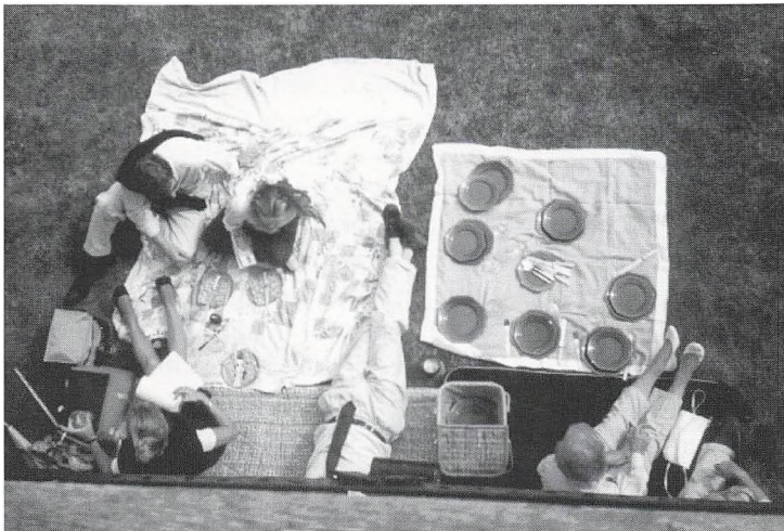
Frokost i det grønne.