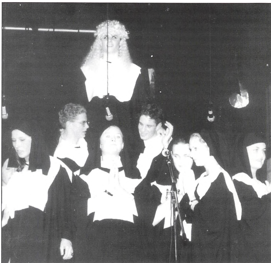
Forårskoncerten, lidt af et udstyrsnummer.

Efter højtideligheden i kirken var skolen vært for en sammenkomst i festsalen for pårørende og inviterede gæster - og for diplerne blev eftermiddagen også en god optakt til de lokale arrangementer til festligholdelse af befrielsen, hvor de deltog i fakkeltog og illumination af skolen. □