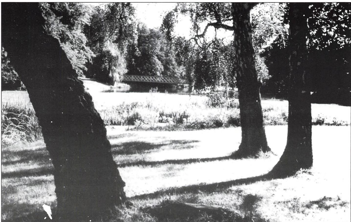
To billeder fra fru Eskildsens album.