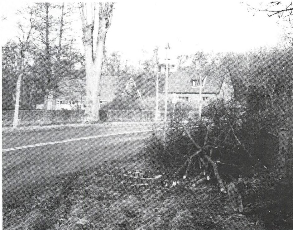
Til venstre det nye hus ved Kark. I forgrunden rester af stormfældet træ.

Et vigtigt skridt er taget med at realisere et nyt koncept for 10. skoleår, præparandklassen. Bag det lidt altmodische navn gemmer sig tanken om at »forberede« en bestemt gruppe elever bedre til gymnasiet. Det har været vores erfaring gennem de seneste år, at mange 1.g'ere har manglet en mere direkte forberedende undervisning som grundlag for gymnasiet. Det drejer sig dels om de ganske mange elever fra udlandet, der ikke har haft dansk som skole- eller arbejdsprog, som har gået i fremmede skolesystemer og derfor har manglet en viden, der forventes hos danske elever, der er blevet erklæret »egnede«. At udlandsdanske så har klare fortrin i gode sprogkundskaber er godt, også for helheden, men det kan ikke fjerne den ulempe som svage danskundskaber er i en række fag med stort læsepensum. Gennem et år i præp-klassen kan bogligt begavede og gymnasieegnede elever sikre sig et grundigt fundament (og får samtidig sidegevinsten i form af Folkeskolens uddannede afgangsprøve). Undervisningen er tilrettelagt og vil blive udført af lærere fra både grundskole og gymnasium (Herlufsholm huser jo begge skoleformer under ét tag!) - og samtidig vil man med specielt henblik på udlandsdanske kunne tilbyde et så fleksibelt skema, at diple med behov for særlig støtte kan få tilbudt den nødvendige ekstrahjælp. Præp-klassen bliver naturligvis også et tilbud til elever med dansk skolebaggrund, herunder dagelever, som hermed tilbydes optagelse i hovedskolen