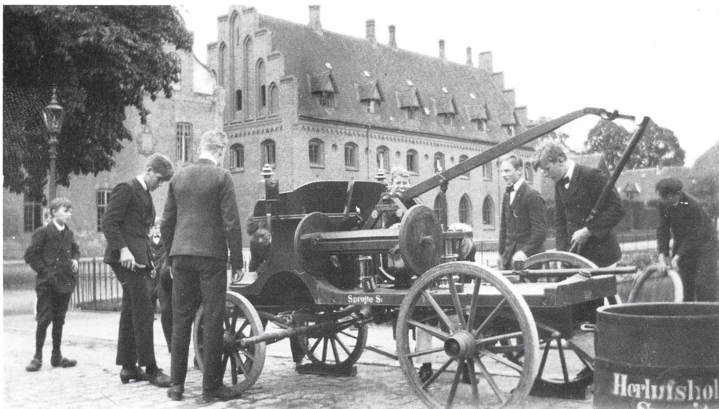
Brandsprøjten, august 1921.

kemiker), mens han mumlede besked om den videre færd gennem skovene. Eller drengenes stakåndede beretninger ved hjemkomsten om den spritter, der lå i en grøft og råbte efter dem. Meget uhyggeligt! (Det var H.K. fra 3.g, der havde lånt en gammel frakke, som han havde hældt kogesprit på).