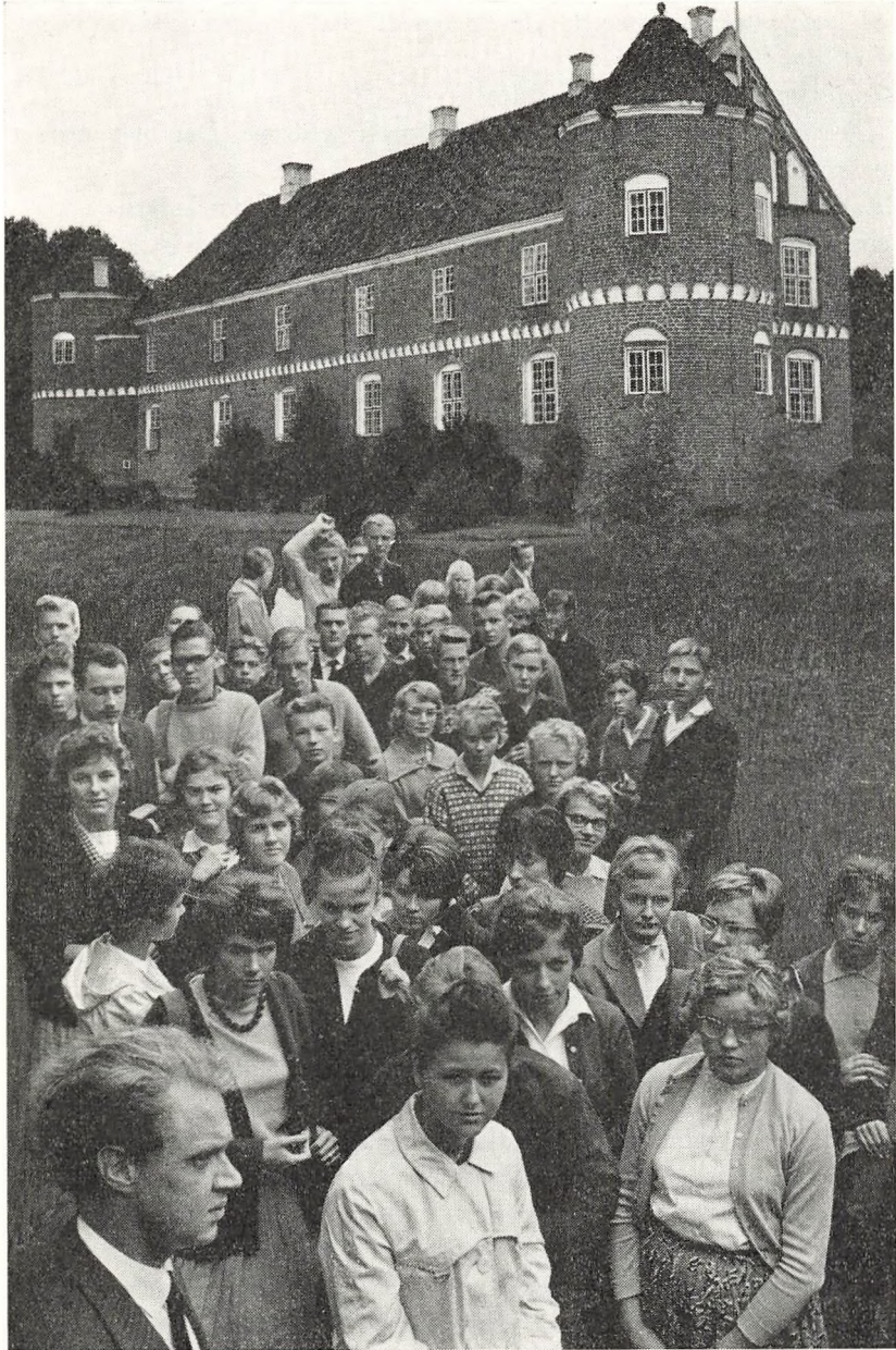
På udflugt til Løvenholm