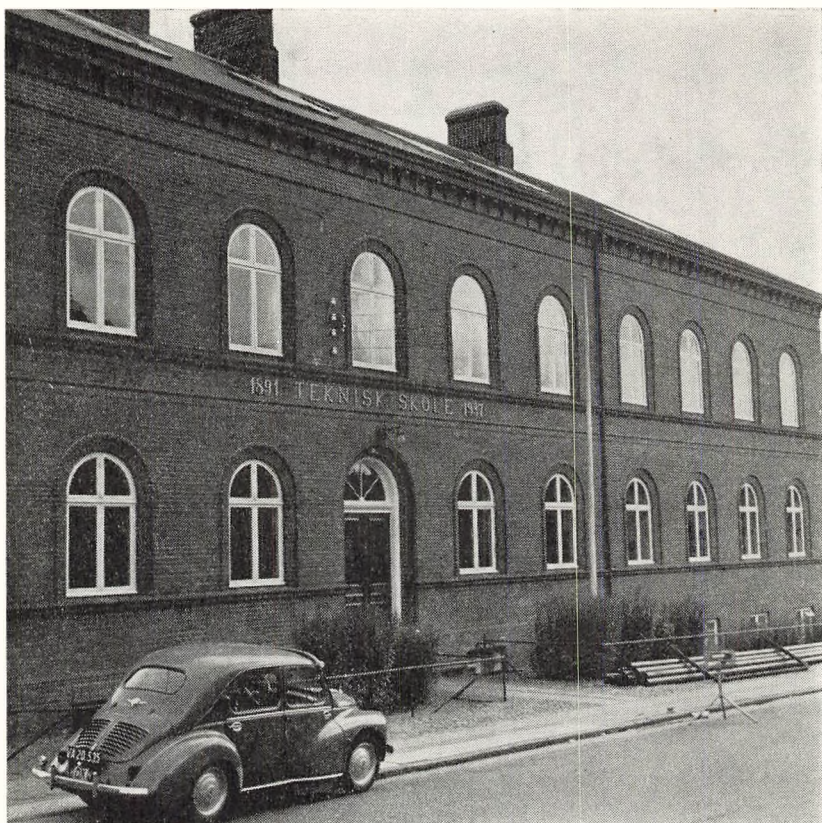
Teknisk Skole, hvor undervisningen har fundet sted i det første skoleår