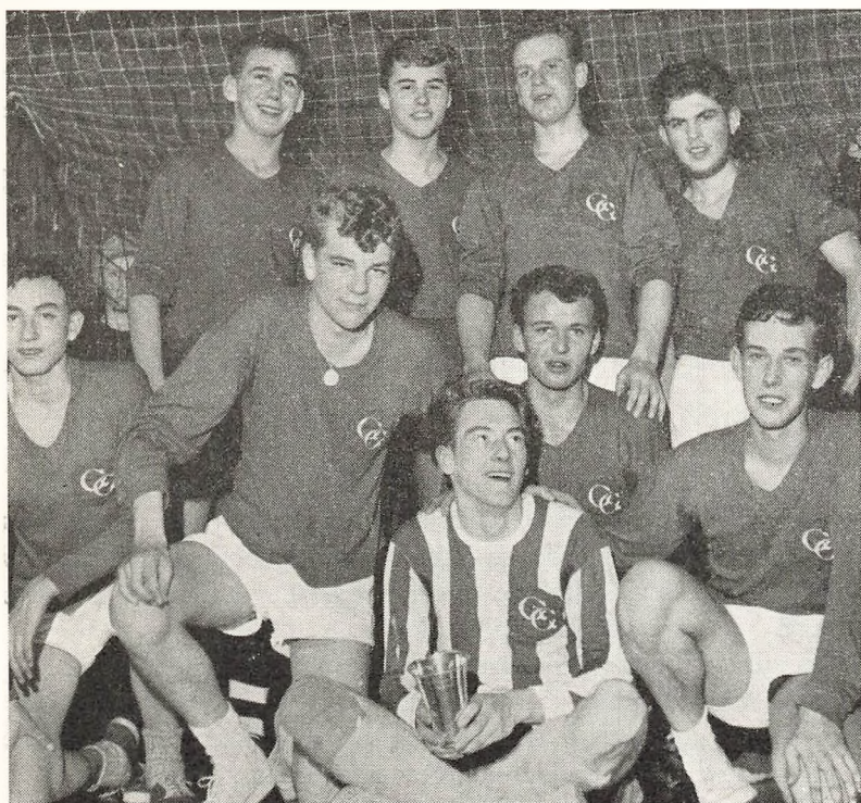
Vinderholdet i Dagbladet Djurslands håndboldturnering

5. marts deltog et drenge- og pigehold i den af Dagbladet »Djursland« arrangerede turnering i Grenaahallen. Pigerne blev slået ud af Trustrup 5-2, hvorimod drengene efter to sejre, henholdsvis over Ebeltoft med 9-2 og Glæsborg med 10-1, endte i finalen, og efter en spændende kamp med det velspillende hold fra Østre Skole vandt 4-2 og dermed hjemførte pokalen.