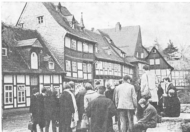
På rundtur i Goslar

oplyst af gaslamper. Næste morgen kl. 8,00 hentede en guide os og fortalte om byen og dens rigdomskilde, Rammelsberg, hvor der udvindes guld, sølv og kobber. Derefter gik vi en tur til de vigtigste seværdigheder, kejserslottet, Siemenshuset, rådhuset, Butterhanne og das Brusttuch. Kl. 9,30 startede bussen på rundturen i bjergene; vi tog først til Bad Harzburg, hvor vi var oppe med svævebanen på toppen af Burgberg, hvorfra vi kunne se over til Brocken i østzonen; efter en spadseretur ned ad bjergstierne fortsatte vi forbi Radauvandfaldet til Braunlage, hvor vi gik en tur ned til zonegrænsen; derefter gik turen til Sankt Andreasberg, hvor vi tog op med en skilift til et lille gæstgiveri, hvor vi fik frokost; efter frokosten fortsattes til Bad Grund, hvor vi så drypstenshulerne ved Iberg, efter besøget her gik turen gennem Clausthal-Zellerfeld til den store Okertalsperre, hvor adskillige kvadratkilometer land er oversvømmet for at danne et vældigt vandreservoir. Gennem den kønne Okertal gik turen tilbage til Goslar, hvor der lige blev tid til en lille tur gennem den påskepyntede by inden lukketid.