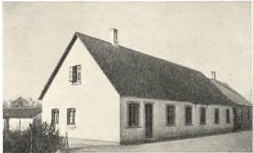
Søllinge Friskole med tilhørende Øvelseshus (i Forgrunden).

Friskolens ydre Glans svandt forholdsvis hurtigt i Tiden efter Verdenskrigen, da andre Indflydelser, udsprunget