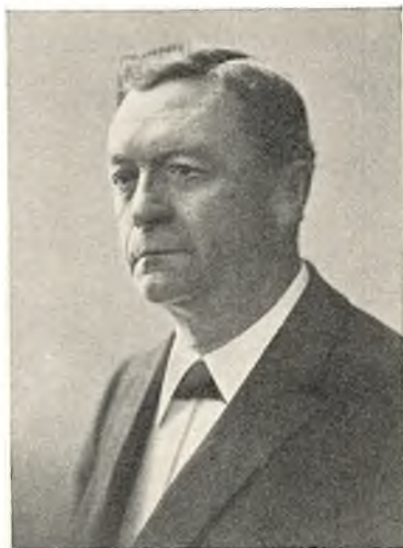
Konsejlspræsident Klaus Berntsen, født i Eskildstrup 12/8 1844, død i København 27/3 1927.