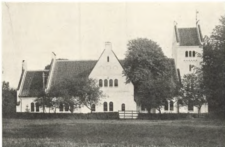
Nazarethkirken i Ryslinge, oprindelig bygget 1866 af den da nystiftede Valgmenighed, ombygget til den nuværende Skikkelse 1898 efter Tegning af Arkitekt Carl Brummer.