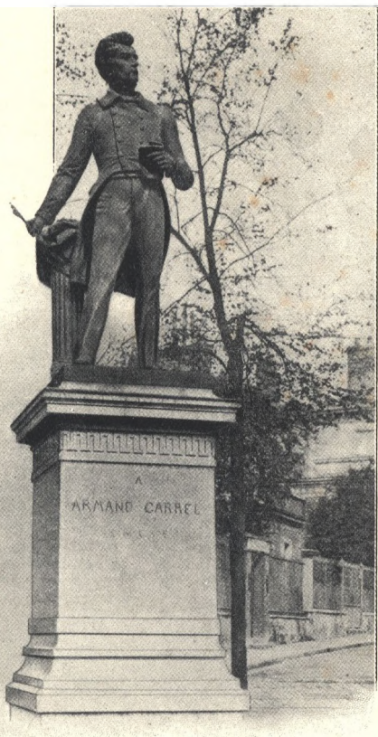
STATUE AF ARMAND CARREL I ROUEN