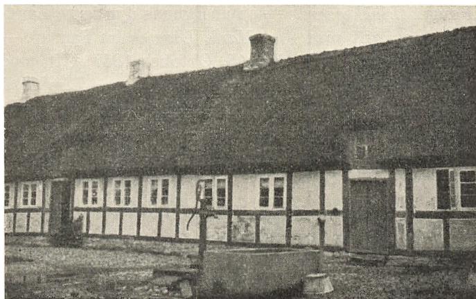
Stuehuset i Nørager.