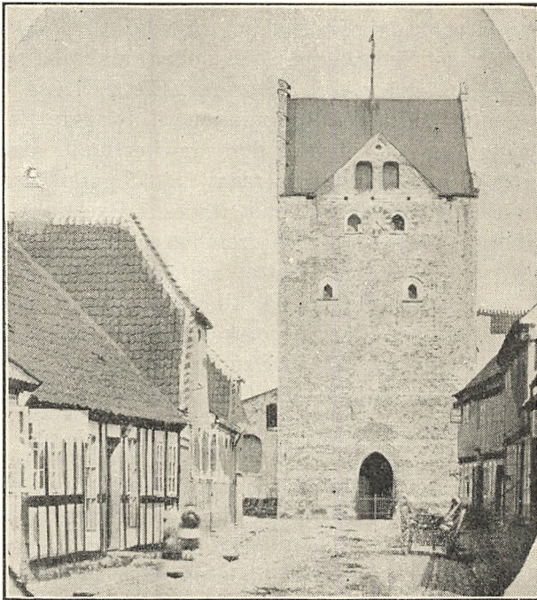
Gammelt Billede af Grenaa Kirke med det øverste af Storegade, efter Fotografi fra ca. 1865.

Bog “ fra 1660. I denne har de forskellige Sognes Præster efter et bestemt af Biskoppen angivet Skema anført en Række Oplysninger om Kirkernes Tilstand