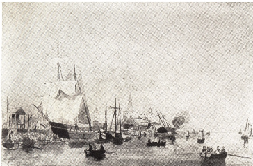
Helsingør Havn 1859

Tegning af C. F. Sørensen paa Handels- og Søfartsmuseet paa Kronborg