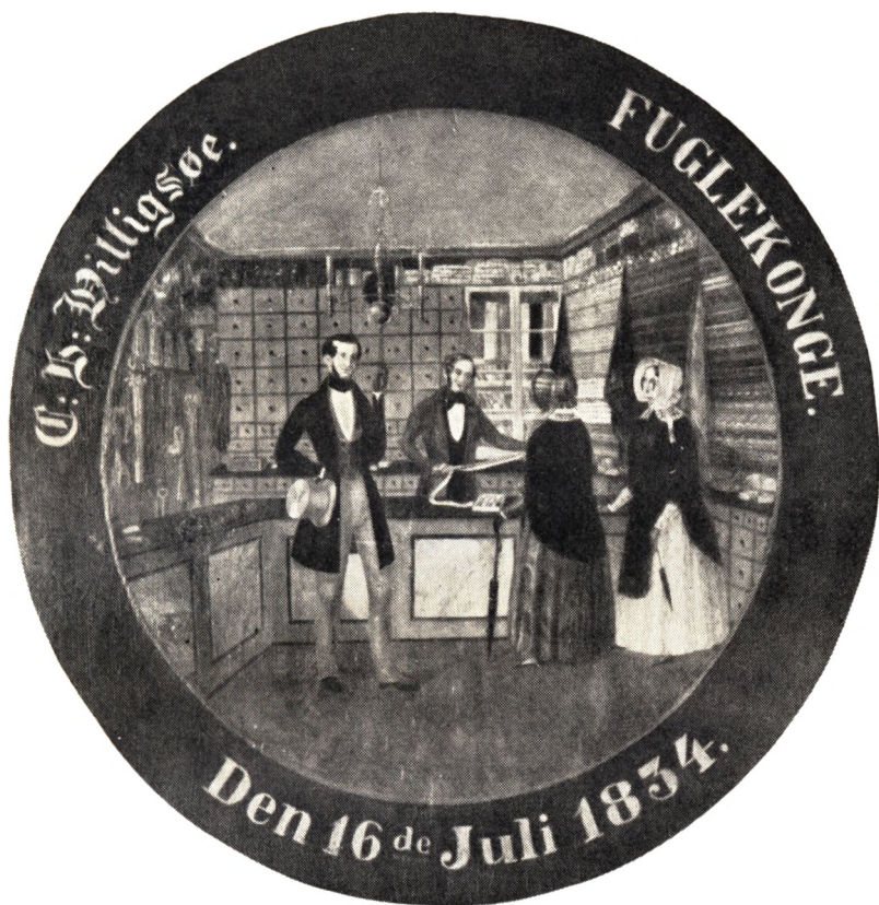
Interiør fra Engelbrecht Hilligsøes Manufakturhandel Efter Skydeskive i Helsingørs kongelig privilegerede Skydeselskab