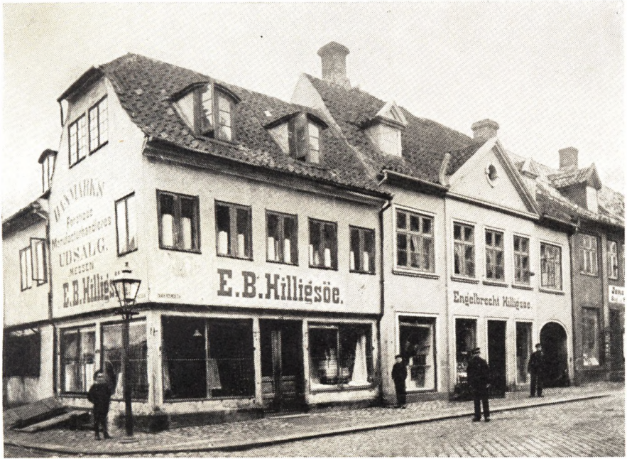
Købmand Engelbrecht Hilligsøes Ejendom paa Hjørnet af Fisketorvet og Stengade