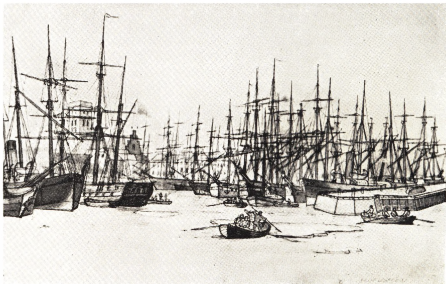
Skibe i Helsingørs Havn under Isdrift i Sundet 1866 Efter Tegning af Carl Baagøe i Handels- og Søfartsmuseet paa Kronborg

med over 20 Aars Tjenestetid i Lauget 100 Kr. Ministeriet fik samtidig Bemyndigelse til at træffe Aftale med de Personer, der fremtidig vilde paatage sig det nødvendige Færgeri.