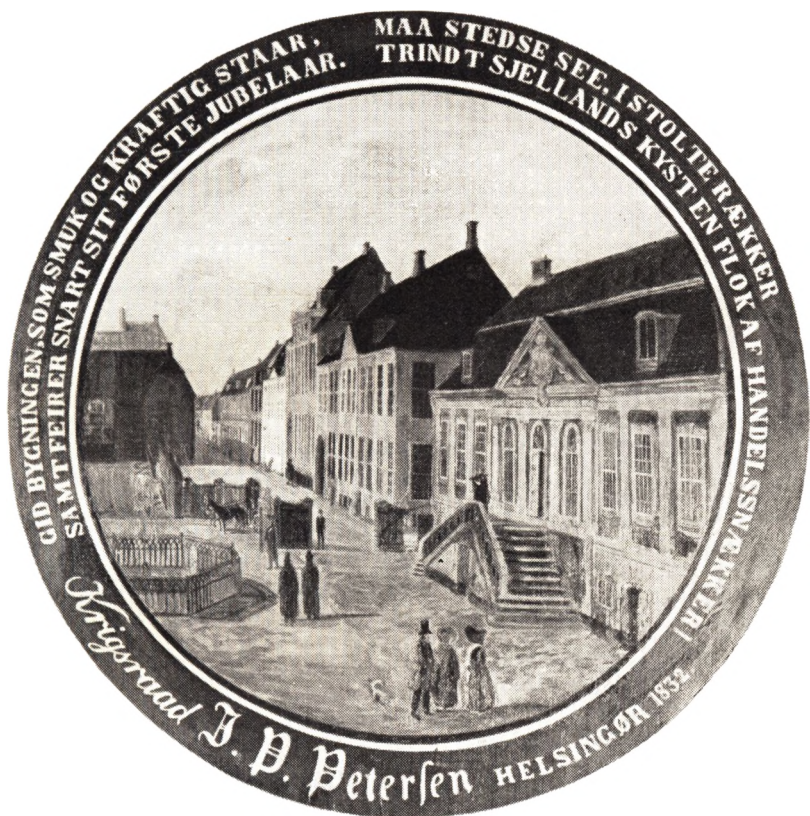
Strandgades Udløb ved Havnen. I Forgrunden Øresunds Toldkammer. Skydeskive i Helsingørs kongelig privilegerede Skydeselskab.