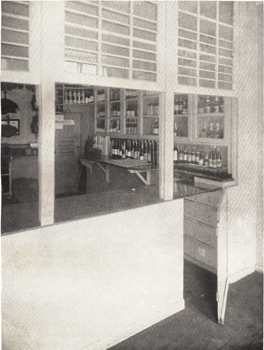
Gammel Købmandsbod i den Galschiøt-Kierboeske Købmandsgaard, Strandgade Nr. 91