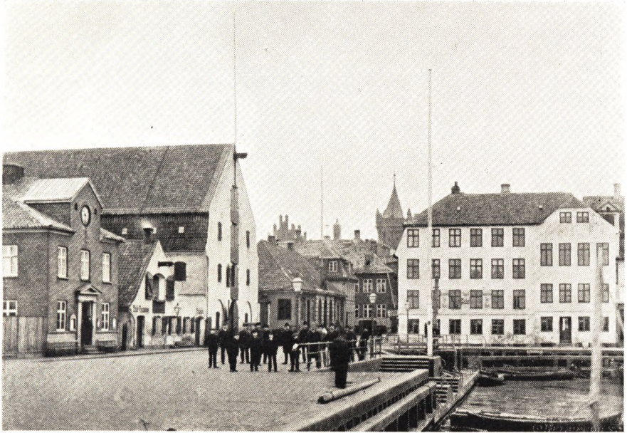
Helsingør Havneplass omkring 1890 Til venstre det gamle Havnekontor, Toldbodpakhuss og Toldbod, der nedreves 1891. Tilhøjre „Skibet“.