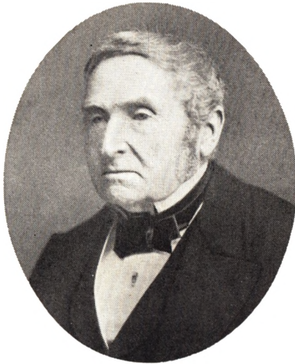
Sundklarerer K. F. MARSTRAND