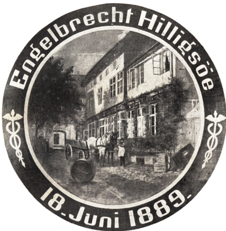
Interiør fra Engelbrecht Hilligsøes Gaard Efter Skydeskive i Helsingørs kongelig privilegerede Skydeselskab

Baade Skibene og tilbød at handle om Proviant og Skibsfornødenheder. Fra danske Myndigheders Side blev der ikke skredet ind, medens danske Skibe, der gjorde noget tilsvarende udfør Helsingborg blev opbragt af svenske Kontrolbaade og fik Varerne konfiskeret. En anden Gang klager Bestyrelsen over, at svenske Dampskibe i Kattegat prajer franske Skibe og gør disse opmærksomme paa, at Frekventsen med de svenske Sundhavne ikke hæmmes ved Foranstaltninger fra Karantænevæsenets Side. . . For ikke at blive slaaet ud af „Helsingborg, denne i stærk Opkomst værende Plads, hvis rige Opland og Ressourcer tilbyder Fordele, vi ej ere i Besiddelse af, bør man fra dansk Side hurtigst muligt ophæve det stedfindende Lægetilsyn for Skibe fra Frankrig“. Det danske Marineministeriums Svar blev et Afslag.