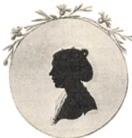
Arenza Birgithe Kierumgaard. 1784—1868.